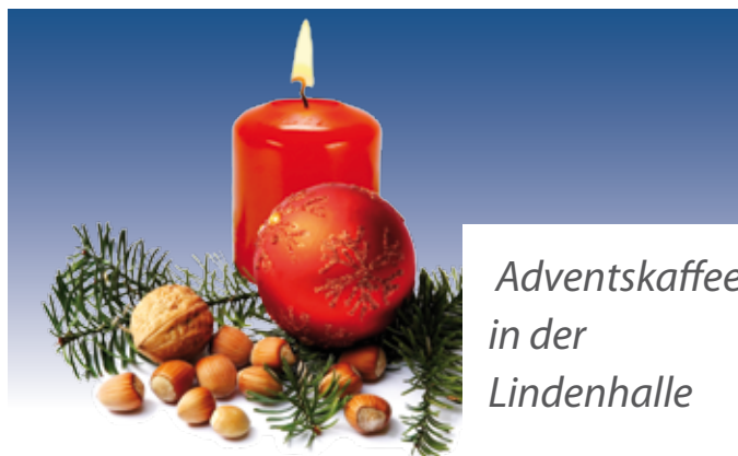
Adventskaffee in der Lindenhalle